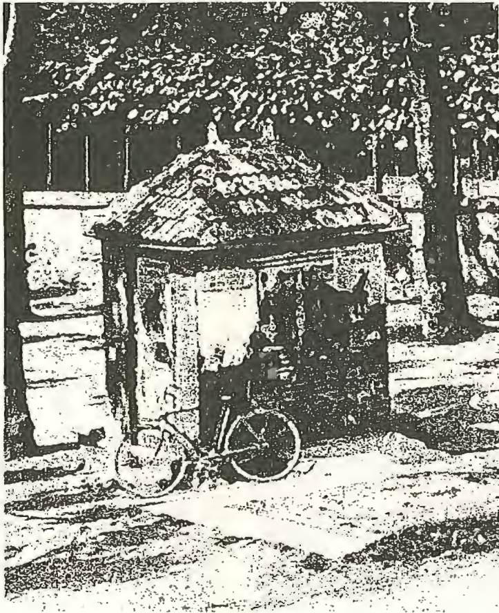
La bascule (poids public), place de Chuzelles, début du XX e siècle. (fragment de carte postale ancienne)