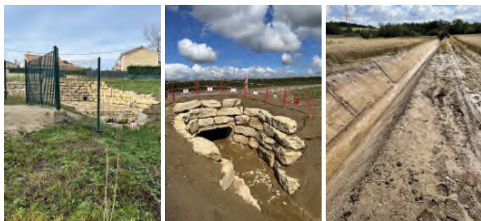
Fosse de dissipation

Ces travaux ont été financés par Vienne Condrieu Agglomération à 75%, le département de l'Isère à 20% et la Direction interdépartementale des Routes Centre-Est pour 5%.