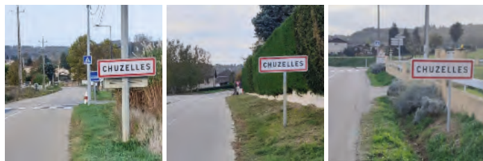
Entrée sud RD 123 Entrée route des Folatières Entrée nord RD123

L'inauguration aura lieu le 25 mars 2023 à 10h.