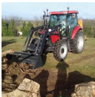
Fossé en amont