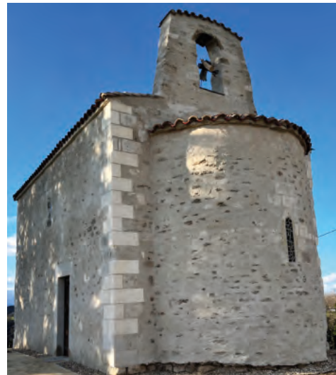
Aspect intérieur et extérieur après travaux